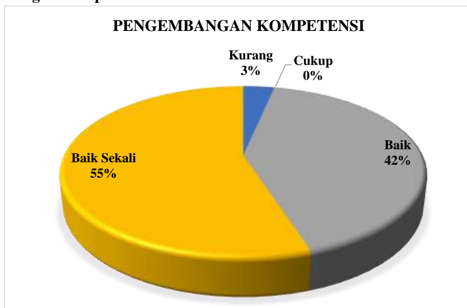
Diagram 3.1 Presentase Hasil Survei Kepuasan Tenaga Kependidikan terhadap Pengelolaan SDM Manajemen pada Aspek Pengembangan Kompetensi

Berdasarkan Diagram 3.1 di atas dapat dilihat bahwa Tenaga Kependidikan yang memberikan nilai Sangat Baik 55% dan Baik sebanyak 42%. Nilai terbanyak terdapat pada poin 3: Kesempatan untuk melakukan pengembangan diri melalui kursus/pelatihan/Seminar/Workshop dalam kampus. Tenaga Kependidikan tidak ada yang memberikan penilaian Cukup dan memberikan penilaian Kurang sejumlah 3% pada aspek ini. Sehingga pada aspek Pengembangan Kompetensi berada pada kategori Baik Sekali .