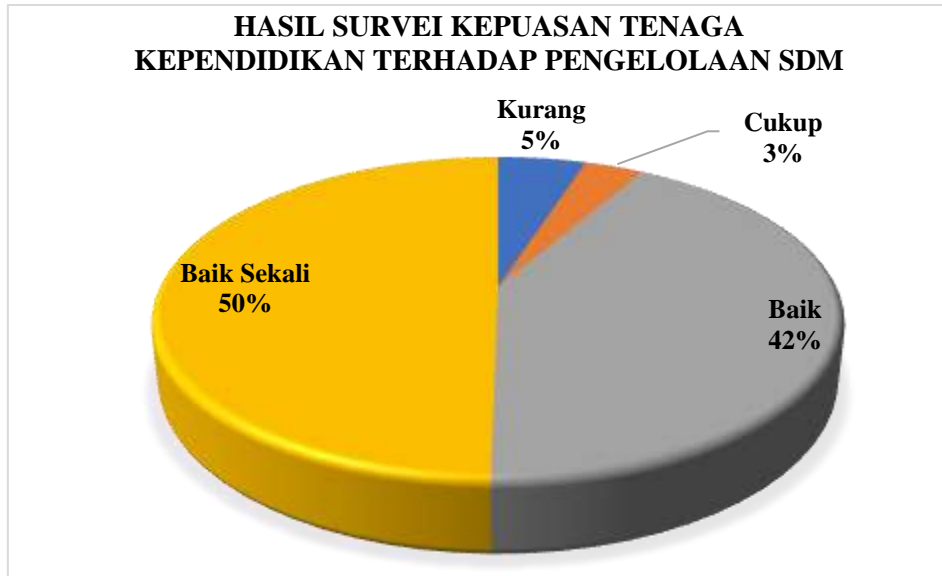
Diagram 4.1 Persentase Hasil Survei Kepuasan Tenaga Kependidikan terhadap Pengelolaan SDM Prodi Manajemen

Berdasarkan hasil survei dapat dilihat pada Diagram 4.1 yang menggambarkan bahwa secara keseluruhan Tenaga Kependidikan program studi Manajemen memberikan nilai Baik Sekali sejumlah 50%, nilai Baik sejumlah 42%, nilai Cukup sejumlah 3%, nilai kurang 5%. Jika merujuk pada Tabel 2.3 nilai persentase tersebut berada pada rentang 41-60%, sehingga dapat disimpulkan bahwa kepuasan Tenaga Kependidikan terhadap Pengelolaan SDM di program studi Manajemen masuk pada kategori CUKUP BAIK .