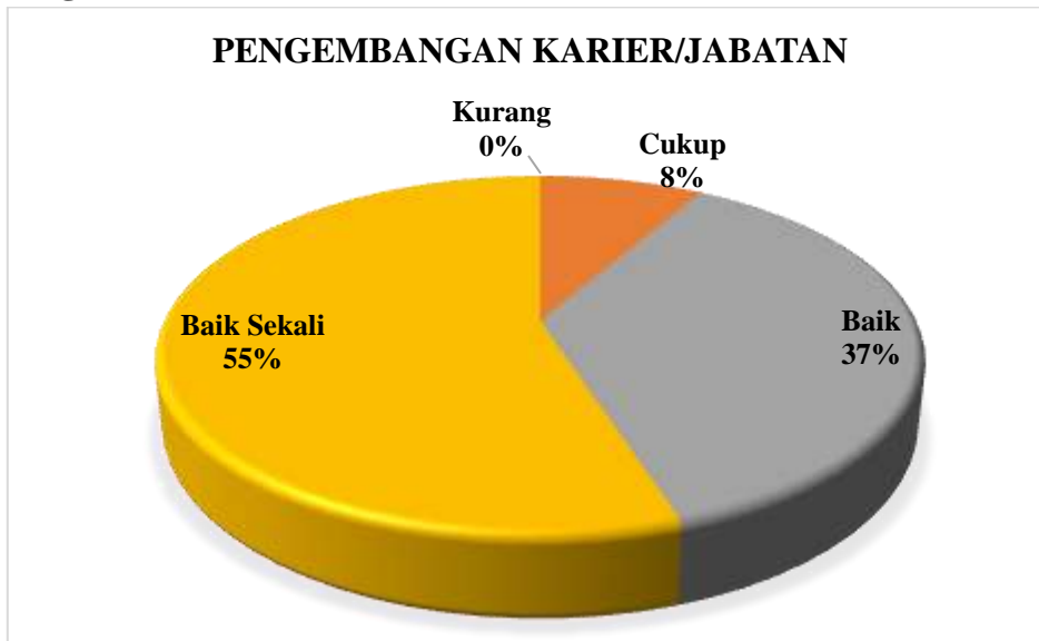
Diagram 3.2 Persentase Hasil Survei Kepuasan Tenaga Kependidikan terhadap Pengelolaan SDM Manajemen pada Aspek Pengembangan Karier/Jabatan

Berdasarkan Diagram 3.2 dapat dilihat bahwa Tenaga Kependidikan memberikan nilai Baik Sekali sejumlah 55% dan Baik sejumlah 37% pada aspek Pengembangan Karier/Jabatan. Nilai terbanyak terdapat pada poin 4: Pimpinan melakukan evaluasi kinerja tenaga kependidikan secara berkala. Tenaga Kependidikan memberikan nilai cukup sejumlah 8% dan tidak ada yang memberikan nilai kurang pada aspek ini. Sehingga pada aspek Pengembangan Karier/Jabatan berada pada kategori Baik Sekali .